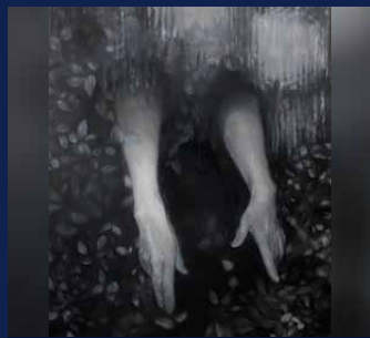
inset window 明神睦美(黒潮町出身)