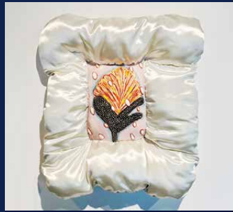
Stuffed Plant "触り方" 内野小春(徳島市出身)