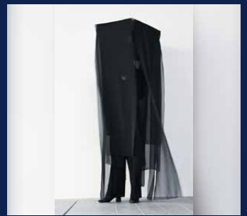
「 」 中村文美梨(高松市出身)